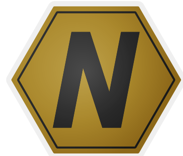
Résultat final du Noh coin Le «N» pour le «Noh» et d'aspect doré pour rappeler une devise sous forme de pièce.